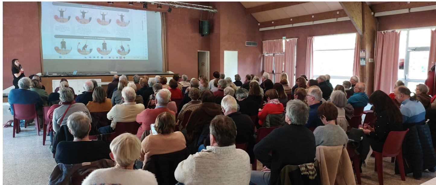
Les ateliers 2024 !

La programmation 2025 est en cours; les ateliers seront organisés dans plusieurs villes de la CCSI .