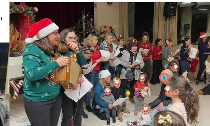
L'équipe du RPE organise chaque année une grande fête des familles, un goûter de Noël (photos) et participe au forum de la petite enfance !