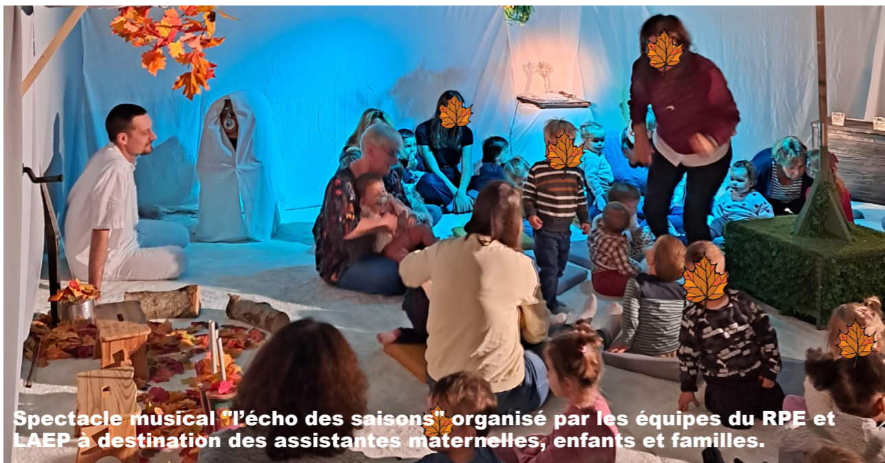
Spectacle musical "l'écho des saisons" organisé par les équipes du RPE et LAEP à destination des assistantes maternelles, enfants et familles.

Un calendrier indiquant les lieux et les villes est édité chaque trimestre (voir site de la CCSI).