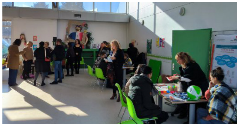
Forum de la petite enfance 2024

Cette année, le forum de la petite enfance s'est déroulé à Auvers-sur-Oise; de nombreuses familles ont pu échanger avec les professionnels de notre territoire : crèches (LPCR), halte-garderie, Relais Petite Enfance (RPE), Lieux d'Accueil Enfants Parents (LAEP), assistantes maternelles, Protection Maternelle et Infantile (PMI) et Caisse d'Allocations Familiales (CAF).