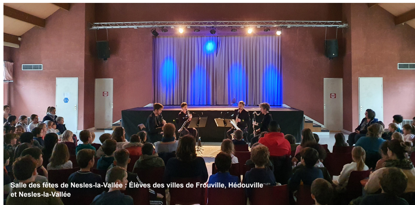
Salle des fêtes de Nesles-la-Vallée : Élèves des villes de Frouville, Hédouville et Nesles-la-Vallée