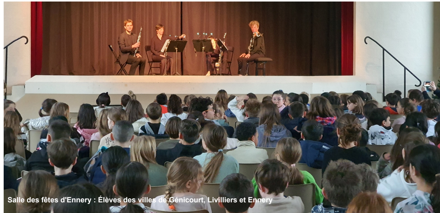
Salle des fêtes d'Ennery : Élèves des villes de Génicourt, Livilliers et Ennery

Prochain concert à l'Église d'Auvers-sur-Oise pour les élèves des villes d'Auvers-sur-Oise, Butry-sur-Oise, Valmondois, Arronville, Épias-Rhus et Vallangoujard.